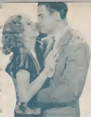
摩律和瓊哈羅愛的表演